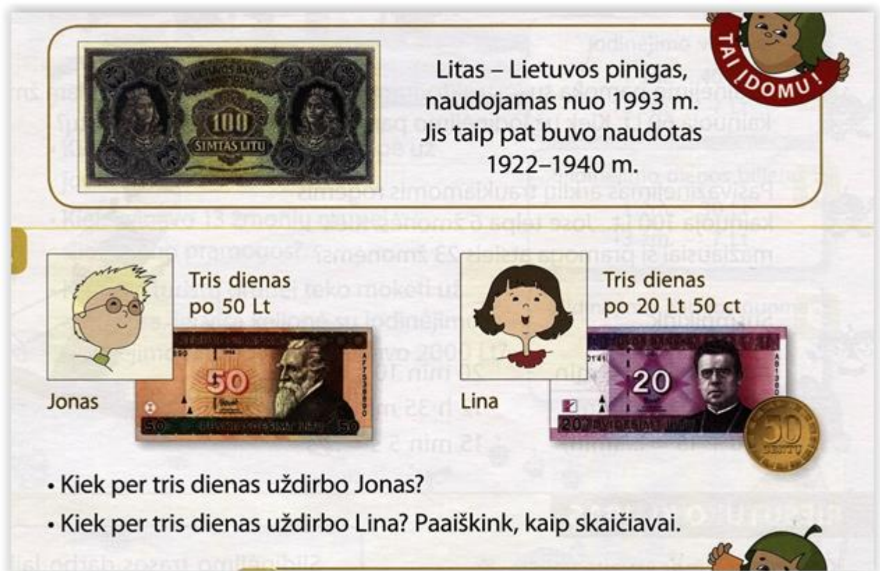
1 pav. Iliustracija iš J.Žvirblienės matematikos vadovėlio, 4 kl., 2 dalis, 2011 p.40.

Vaikų socializacijos procese svarbūs vadovėliai iš kurių jie mokosi mokyklose. Neretai vaikų vadovėliuose sutinkamos stereotipinės nuostatos lyčių atžvilgiu žr. pateiktus paveikslėlius. 1 pav. iš matematikos vadovėlio (2011) kuriama nuostata, kad moterys uždirba gerokai mažiau nei vyrai, nors statistiniai duomenys rodo, kad moterys uždirba 16 proc. mažiau nei vyrai. Todėl pateikta iliustracija yra stereotipinė ir neatspindi realios situacijos.